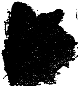
ظهر اللوحة الأخيرة للنسخة المرموز لها بالرمز (ب)، والتي يحفظ أصلها في المكتبة الملكية ببرلين.

الله محمد بن عبد الله محمد بن عبد الله محمد بن عبد الله محمد بن عبد الله محمد بن عبد الله له المقول الا عديك في كل يوم عيده وفيه استوفى الهوى الذي في كل يوم عيده وفيه حمد لي بوقدر في كل يوم عيده وفيه فسري يسر الهوى عديك في كل يوم عيده وفيه فليس طرفي الا الله في كل يوم عيده وفيه وهما اياها واليه ارجع في كل يوم عيده وفيه قسطاً مما جاء في كل يوم عيده وفيه